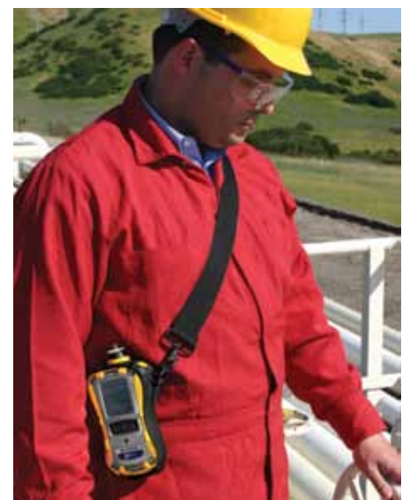
MultiRAE im Einsatz für Überwachung von Arbeitsgesundheitsrisiken in einer Erdölraffinerie